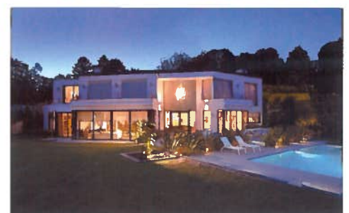
La domotique pour tous ? Un confort désormais accessible !