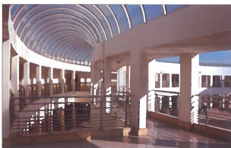
ENA, classé meilleur établissement supérieur au Maroc